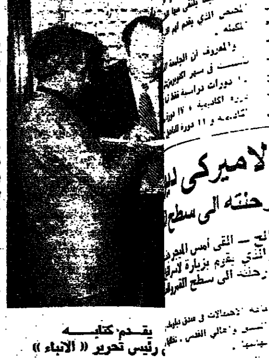
يقدم كتابه و رئيس تحرير ( الانباء )